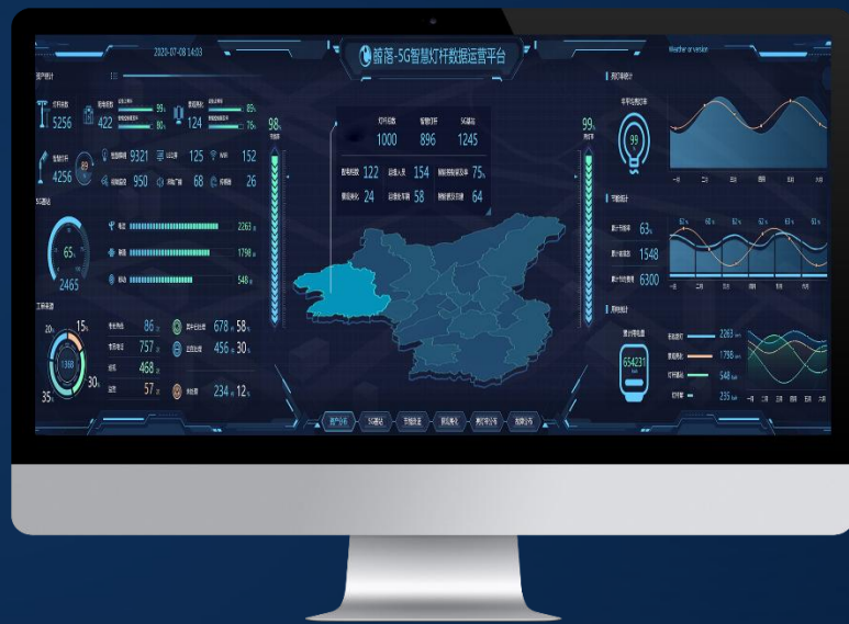
“鲸落”5G智慧灯杆数据 运营 平台