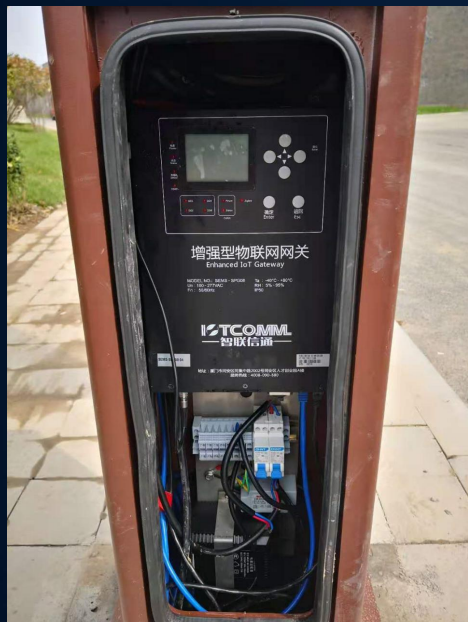
增强型硬件设备安装