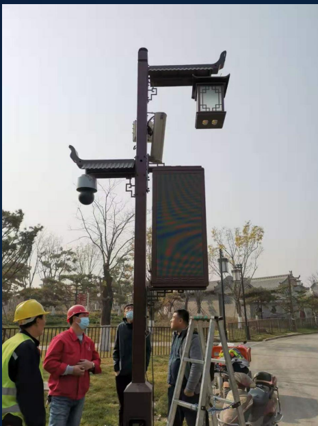
安装现场积极协调推进