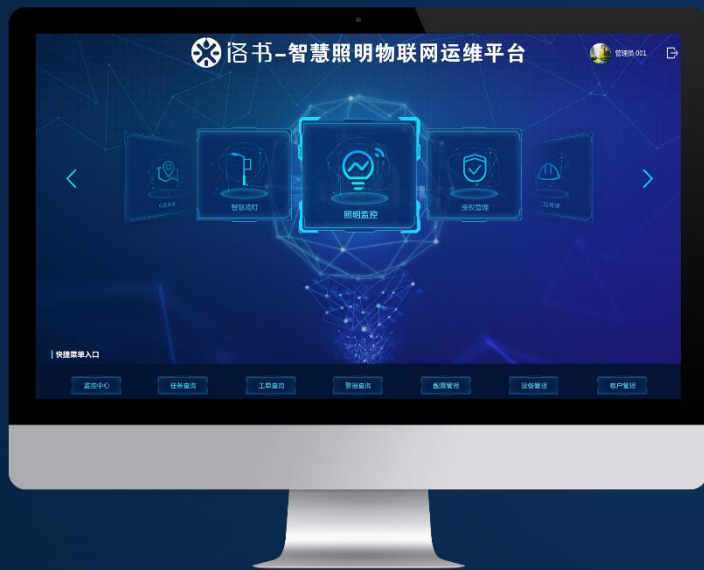
“洛书”智慧照明物联网 运维 平台

通过“一个平台、N大应用系统”，建立“用数据说话、用数据管理、用数据决策、用数据创新”的全流程“建、管、养、营”一体化运维及运营管理模式